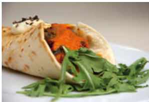
TAPA 2 BURRITO VEGANO TEXMEX

Masa de espelta integral con verduras de temporada y frutos secos.