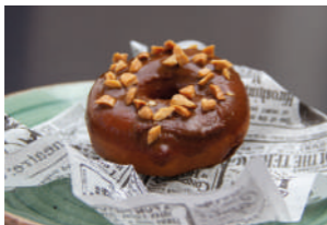
TAPA 1 HOMERO

LUNES MARTES MIÉRCOLES JUEVES / 19:00 - 20:30 VIERNES / 19:00 - 20:30 SÁBADO / 19:00 - 20:30 DOMINGO