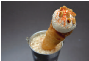
TAPA 2 CUXIMET

Falsa rosquilla rellena de tombet de habas y carne de cocido, terminada con salsa de jugo de carne y almendra marcona.