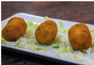
TAPA 2 LAS VEGANAS

LUNES MARTES MIÉRCOLES JUEVES / 20:00 - 23:00 VIERNES / 20:00 - 23:00 SÁBADO / 20:00 - 23:00 DOMINGO