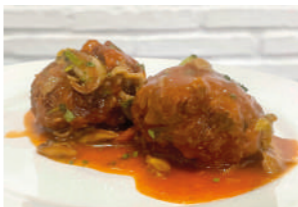
TAPA 2 DE LA ABUELA

Pulpo de costa cocinado lentamente y encebollado.