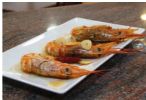
TAPA 1 AL AJILLO

C/ ALCALDE TÁRREGA, 25 964 025 192 @bar_el_gua