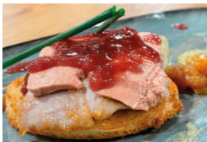
TAPA 2 EL MAÑICO

Chorizo ahumado de Teruel D.O., lentamente cocinado a la sidra y laurel.