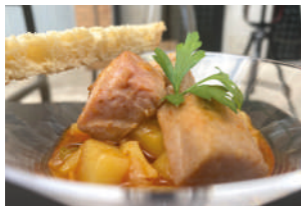
TAPA 1 MARMITAI

Marmitaco tradicional con atún y toques asiáticos.