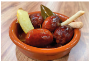
TAPA 1 A LA SIDRA

C/ MAESTRO RIPOLLÉS, 24 964 232 308 @rokelin_m.ripolles