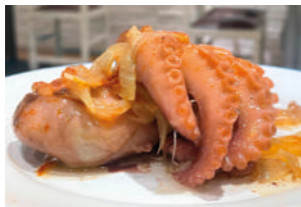
TAPA 1 PULPO NELO'S