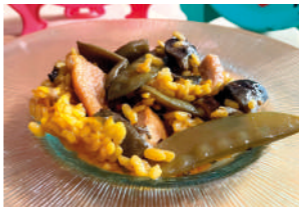
TAPA 2 ARROZ SECRETO

Bacalao salado con patata y huevos, con crujiente de piel de bacalao.