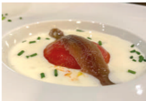
TAPA 2 ME SABE A HUMO, ME SABE A HUMO...

Marmitaco tradicional con atún y toques asiáticos.