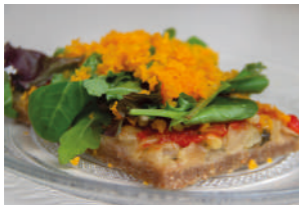
TAPA 1 COCA SABER CUIDARSE

C/ CABALLEROS, 26 665 688 260 @saber_cuidarse