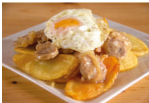
TAPA 1 EL BLANC

C/ PELAYO DEL CASTILLO, 4 964 831 053 @restaurantelasacristia