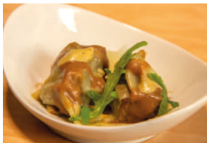
TAPA 1 RABU

LUNES 13:00 - 15:30 / MARTES 13:00 - 15:30 / MIÉRCOLES 13:00 - 15:30 / JUEVES 13:00 - 15:30 / VIERNES 13:00 - 15:30 / 19:00 - 00:00 SÁBADO 13:00 - 15:30 / 19:00 - 00:00 DOMINGO