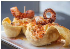
TAPA 2 PALOMAS DE ENSALADILLA

LUNES MARTES MIÉRCOLES JUEVES 12:30 - 15:00 / 19:30 - 22:30 VIERNES 12:30 - 15:00 / 19:30 - 22:30 SÁBADO 13:00 - 15:00 / 19:30 - 22:30 DOMINGO