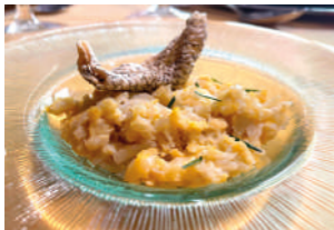
TAPA 1 ABADEJO

AVDA. ALCORA, 246 964 216 481 @restaurante_portoles