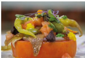
TAPA 1 TOMATITO MIGUELÍN / VERSIÓN 2.2

C/ DR. FLEMING, 9 717 771 927 @casamiguelinbar