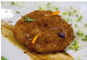
TAPA 2 CÓMEME EL DONUTS

Tomate del terreno con ahumados (mojama, bacalao, sardina, anchoa y boquerón) acompañado de encurtidos y mermelada de oliva verde.