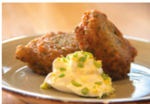
TAPA 2 NUBE

Wanton de rabo de buey con salsa de oporto y foie.