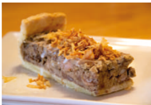
TAPA 2 EL NEGRE

Huevos rotos con blanquet y cebolla caramelizada.