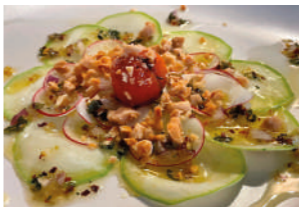
TAPA 2 CARPACCIO VEGANO

Crema de queso azul con sobrasada a la miel, piñones y patata paja.