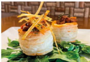
TAPA 1 FANTASÍA

C/ ESCULTOR VICIANO, 15 661 062 037 @labodeguillacastellon