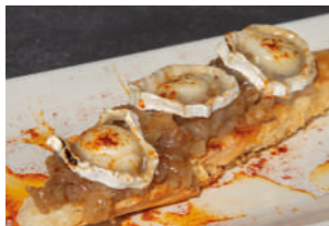
TAPA 1 ROXOS

C/ PÉREZ DOLZ, 9 964 228 508 @baraturuxo